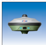
Receptor A70 AR