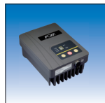
Rádio Externo TRU35