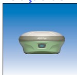
Receptor A60 Pro